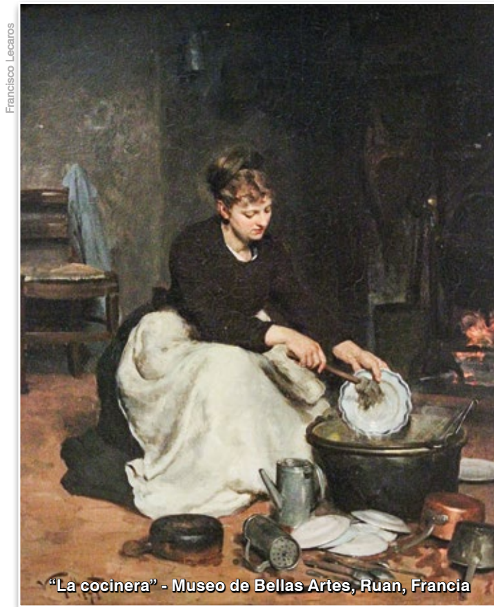
"La cocinera" - Museo de Bellas Artes, Ruan, Francia

El trabajo de una empleada doméstica puede también adquirir esta condición. Si tomamos en consideración su tra-