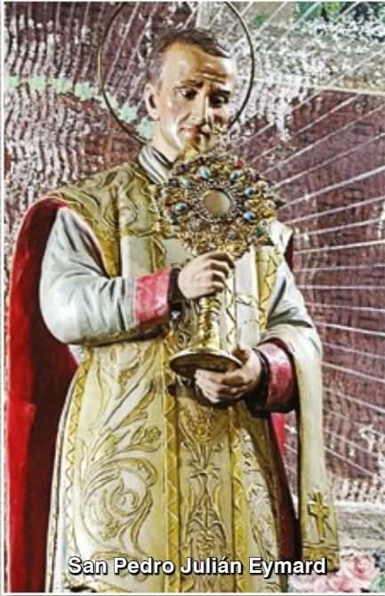
San Pedro Julián Eymard

1. San Alfonso María de Liguorio , obispo y doctor de la Iglesia († 1787).