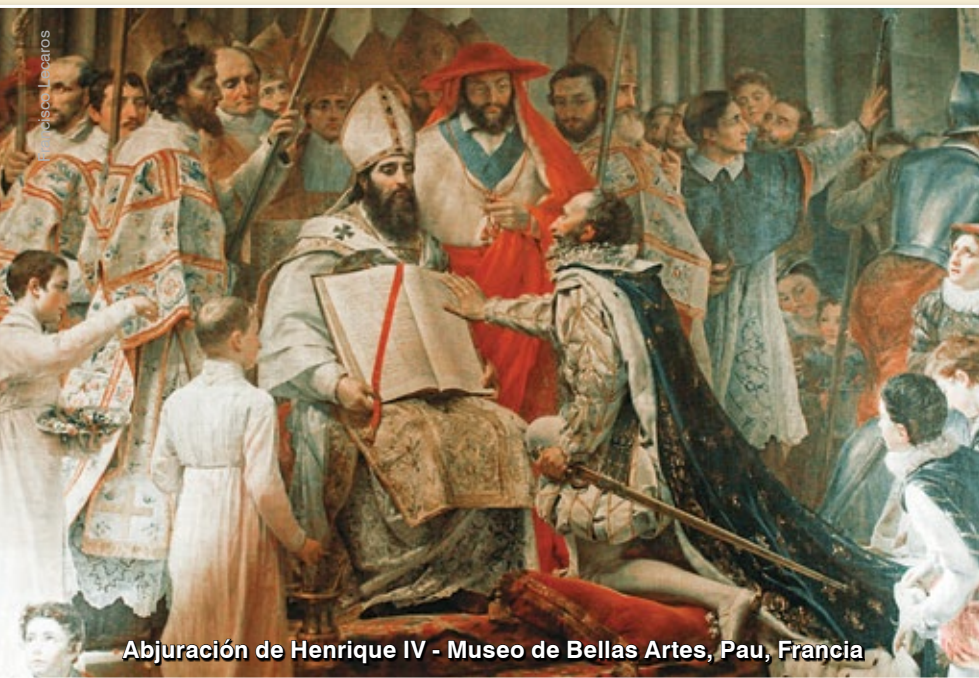
Abjuración de Henrique IV - Museo de Bellas Artes, Pau, Francia

En tiempos de las guerras de religión, la población de París fue el gran baluarte de la Religión Católica, para impedir que Henrique IV subiese al trono como rey oficialmente protestante. Porque el problema de la guerra era este: si un protestante de-