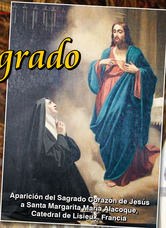
Aparición del Sagrado Corazón de Jesús a Santa Margarita María Alacoque, Catedral de Lisieux, Francia

Si el “Rey Sol” hubiera atendido el mensaje del Sagrado Corazón de Jesús, transmitido a través de Santa Margarita María Alacoque, habría evitado la Revolución Francesa, y la Historia del mundo sería otra.