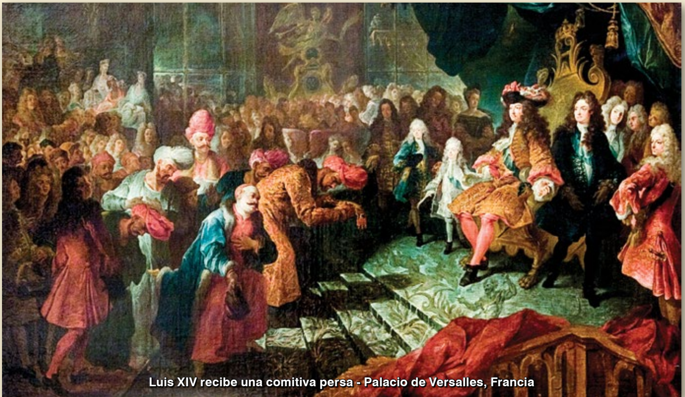
Luis XIV recibe una comitiva persa - Palacio de Versalles, Francia

La fórmula así tomada, parece dar a entender que el rey estaba necesitando de socorro y lo tenía muy claro, y que Nuestro Señor le decía que recurriera a Él, no pedía otra cosa sino la confianza en su Sagrado Cora-