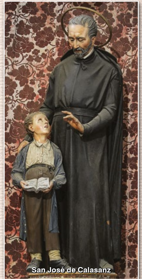
San José de Calasanz

Santos Tiago De Mai Nam , anciano, Antônio Pedro Nguyen Dich y Miguel Nguyen , mártires († 1838). Sacerdote campesino y médico decapitados en Nam Đinh, Vietnam, después de sufrir atroces suplicios.