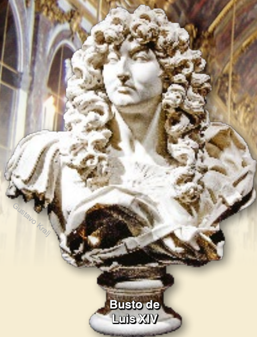
Busto de Luis XIV