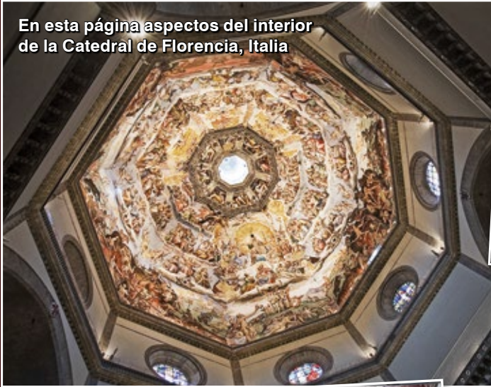
En esta página aspectos del interior de la Catedral de Florencia, Italia