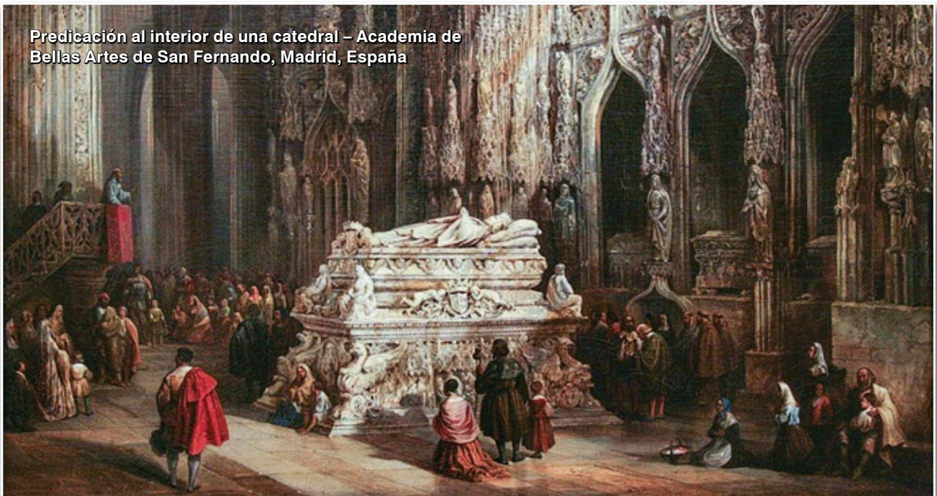
Predicación al interior de una catedral – Academia de Bellas Artes de San Fernando, Madrid, España

El gusto que el individuo ha de tener por su profesión, no debe ser por ganar dinero aunque lo necesite para vivir de ella, sino en el placer de extraer de sí mismo, una cantidad de cosas que duermen dentro de él y que a todo costo las deber sacar para realizarse, para explicitarse así mismo.