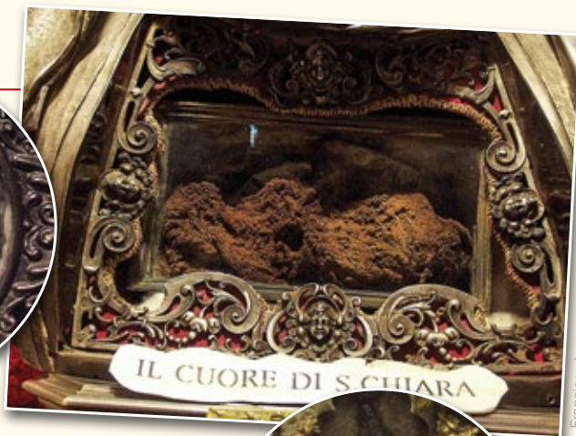
Reliquias de Santa Clara, Monasterio de Santa Cruz, Montefalco, Italia