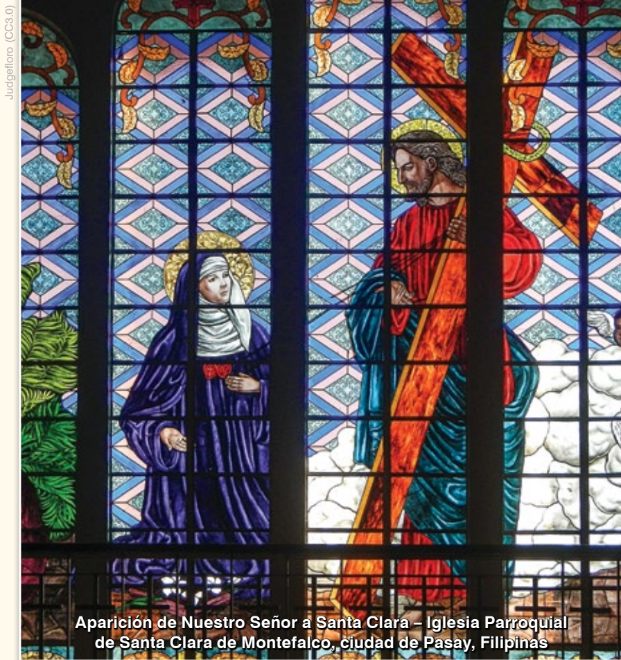
Aparición de Nuestro Señor a Santa Clara – Iglesia Parroquial de Santa Clara de Montefalco, ciudad de Pasay, Filipinas

Esto es más notable, porque parece una contradicción: poniendo en una balanza de dos platos las tres bolas, cada vez que se ponía una bola separada, ella pesaba tanto cuanto las otras dos. Esto es altamente teológico, pues