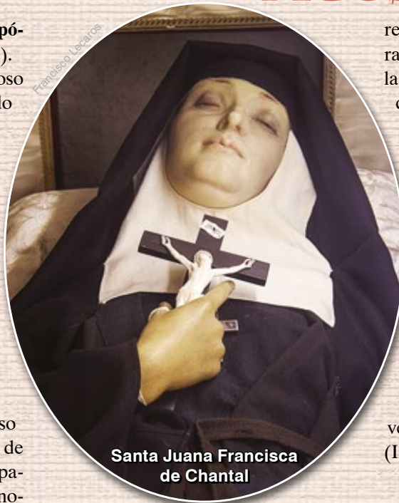
Santa Juana Francisca de Chantal

20. San Bernardo de Claraval, abad y Doctor de la Iglesia († 1153).