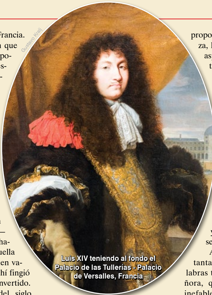
Luis XIV teniendo al fondo el Palacio de las Tullerías - Palacio de Versalles, Francia

En sentido contrario, el París del rechazo de Luis XVI fue el de la Revolución Francesa. ¡Es una cosa tremenda!