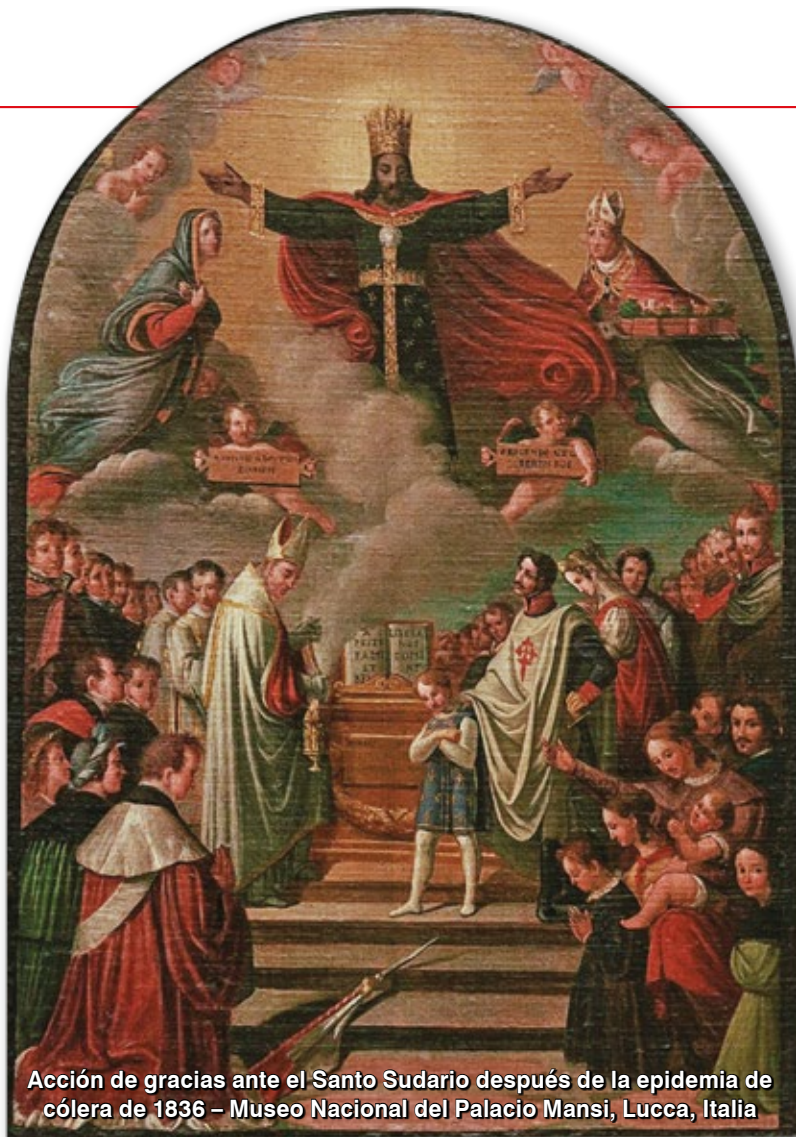
Acción de gracias ante el Santo Sudario después de la epidemia de cólera de 1836 – Museo Nacional del Palacio Mansi, Lucca, Italia

guerreros, o el tesón de ese pueblo está ya liquidado. Porque de todas las actividades humanas ninguna tiene tanta nobleza y tanta analogía con las cosas de Dios, con la luz mental que hay en Dios, como el sacerdocio; es algo evidente. Pero también una sociedad que no produce guerreros es que no odia lo contrario a lo que ella ama y por lo tanto no ama nada; es una sociedad que está en estado de putrefacción. El espíritu sacerdotal y el espíritu guerrero son esenciales en el equilibrio de toda sociedad. ❖