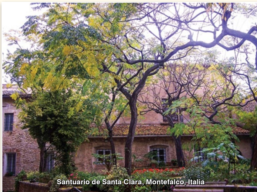
Santuario de Santa Clara, Montefalco, Italia

No fue necesario más que esto para que ella fuese inmediatamente privada de todo consuelo, abrumada de penas interiores. La noche del alma en que