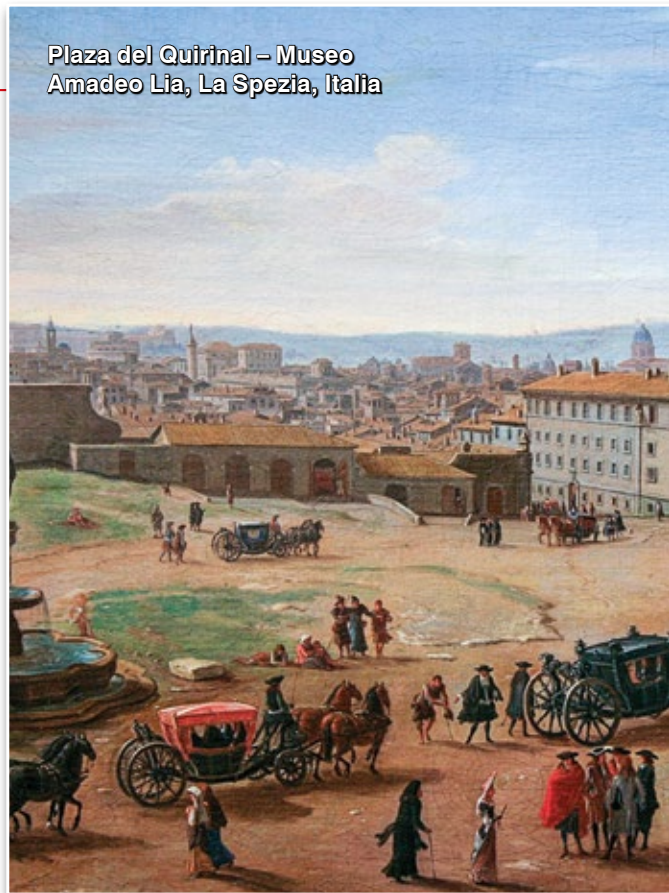
Plaza del Quirinal – Museo Amadeo Lia, La Spezia, Italia

el verdadero profesional no es aquel que quiere ganar dinero, sino, y sobre todo, aquel que colabora con los planes de Dios de acuerdo con un apelo íntimo de su alma, lo cual es una señal de la Providencia para hacer alguna cosa en que él adore y sirva a Dios. Este será el clima del Reino de María.