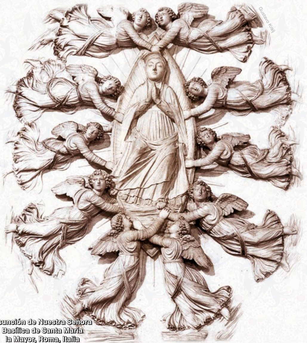
Asunción de Nuestra Señora Basílica de Santa María la Mayor, Roma, Italia