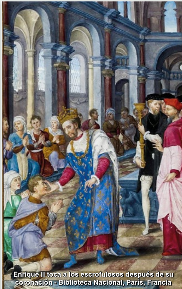
Enrique II toca a los escrofulosos después de su coronación - Biblioteca Nacional, París, Francia

Dieu te guérisse – El rey te toca, Dios te cure. Según una antigua costumbre, inquebrantable a lo largo de los siglos, muchos se curaban.