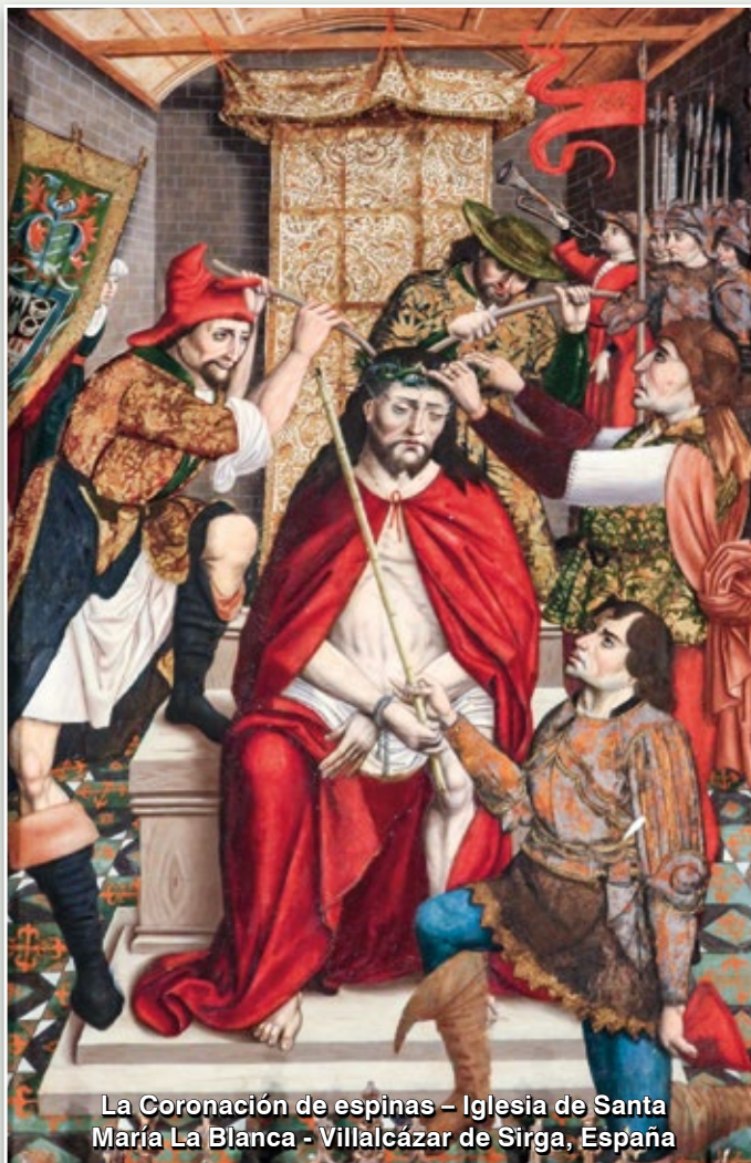
La Coronación de espinas – Iglesia de Santa María La Blanca - Villalcazar de Sirga, España

Esos compendios de Historia usados en los colegios, incluso en las universidades, tratan de toda clase de cosas, de Él no hablan. Aho-