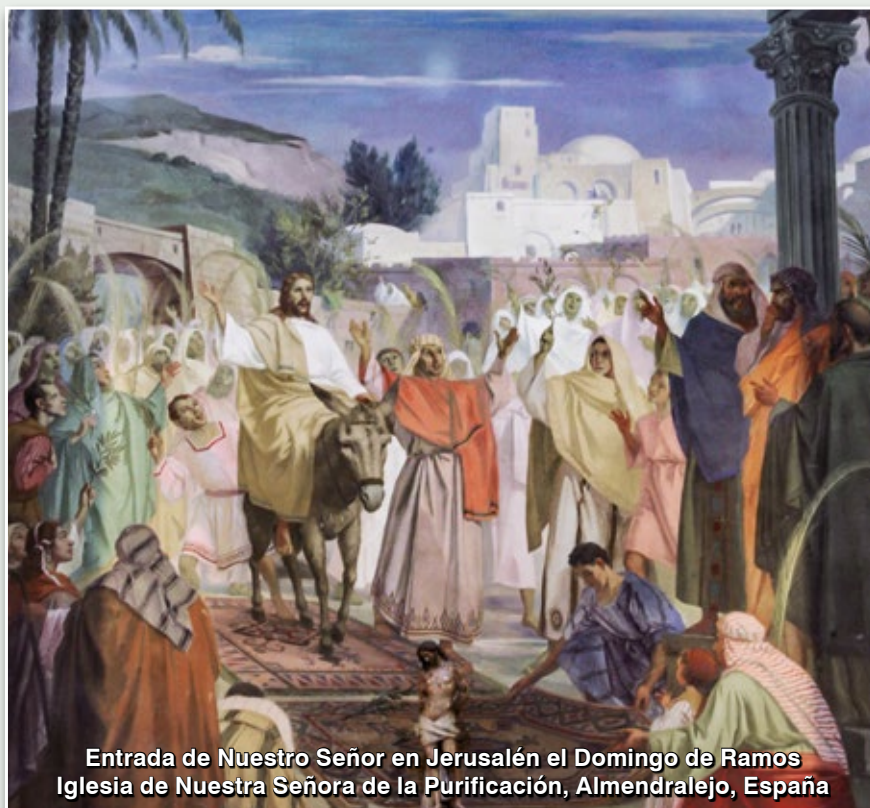
Entrada de Nuestro Señor en Jerusalén el Domingo de Ramos Iglesia de Nuestra Señora de la Purificación, Almendralejo, España

¿Qué rey tuvo o tendrá semejantes funerales? La tierra tiembla, el Sol se oscurece, el velo del Templo se rasga. Con el temblor de tierra, las sepulturas de los justos del Antiguo Testamento se abren y ellos salen por