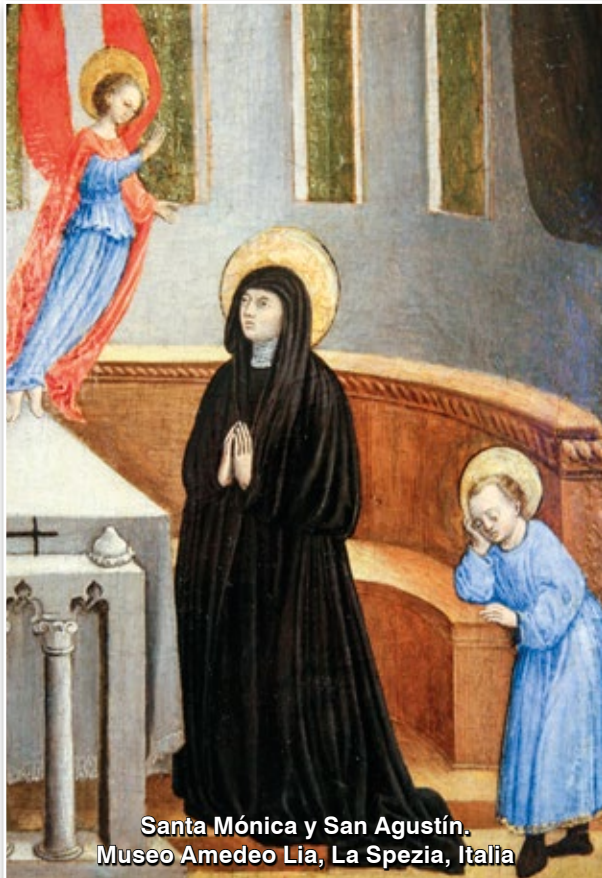
Santa Mónica y San Agustín. Museo Amedeo Lia, La Spezia, Italia

San Agustín se apartaba de ella, esta santa madre iba tornándose más ardiente, arrebatadora en suplicar a Dios y en pedir a su hijo rebelde que se convirtiese, más irresistible en cada contacto con él, porque ella apremiaba sus dones maternos y recursos para salvar aquella alma. Agustín resistía y ella se juzgaba derrotada, sin comprender que, mientras él se iba degradando, ella iba sacando de sí misma recursos y bellezas nuevas, y dando nuevas glorias a Dios; y que su aceptación, en un acto de conformidad y resignación con cada derrota, después de cada “no” de él, marcaba una nueva belleza para ella. Mientras el hijo iba diciendo “no” a Dios Nuestro Señor, que era, así, “vencido” en Agustín, Él iba venciendo en Santa Mónica, hasta el punto de volverse tan vencedora que, por así decir, venció al propio Dios.