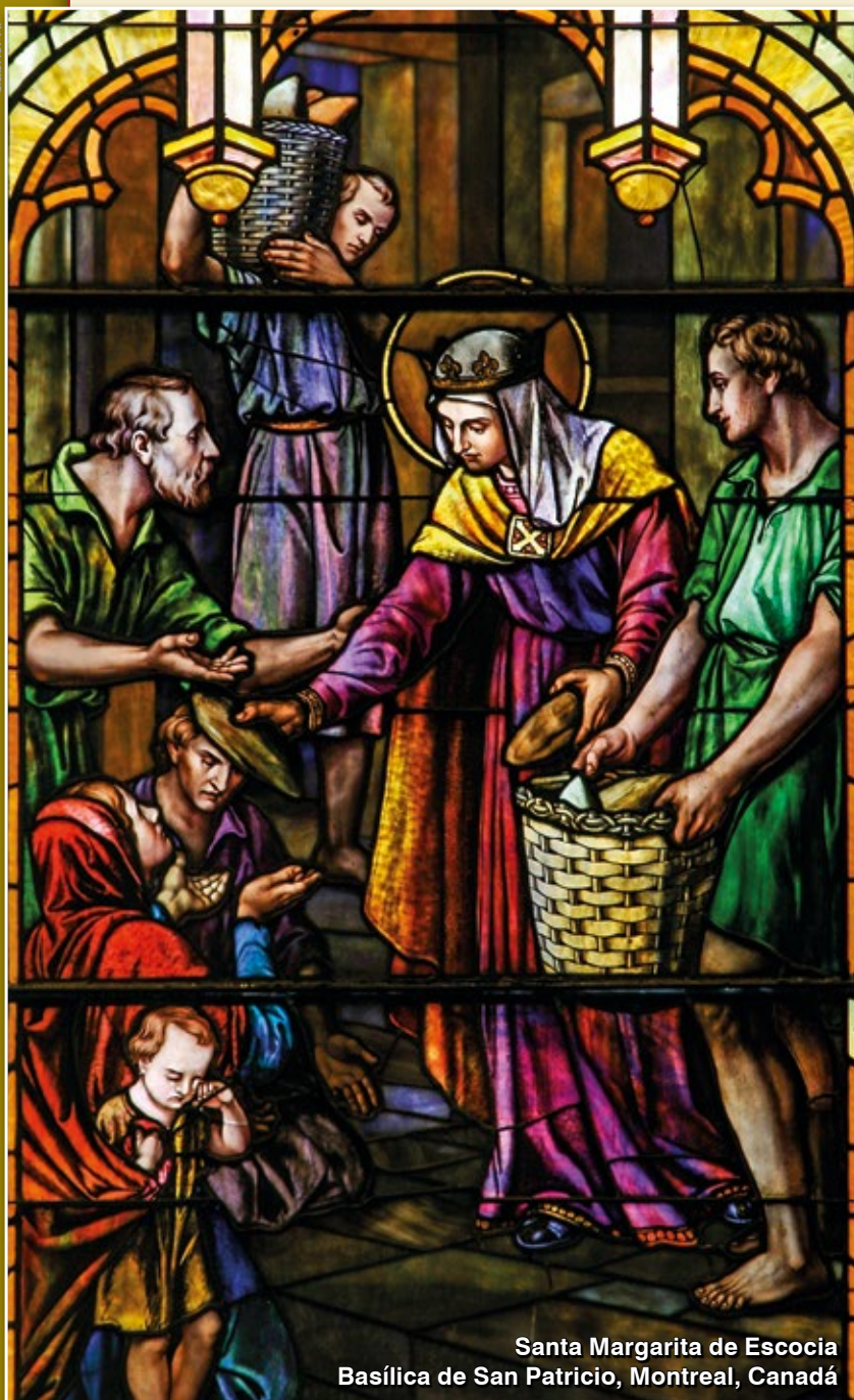
Santa Margarita de Escocia Basilica de San Patricio, Montreal, Canadá

E n la vida de Santa Margarita de Escocia se nota la existencia de lo maravilloso en la Edad Media. No de lo maravilloso como una fábula o una leyenda, sino como algo que puede ser realizado.