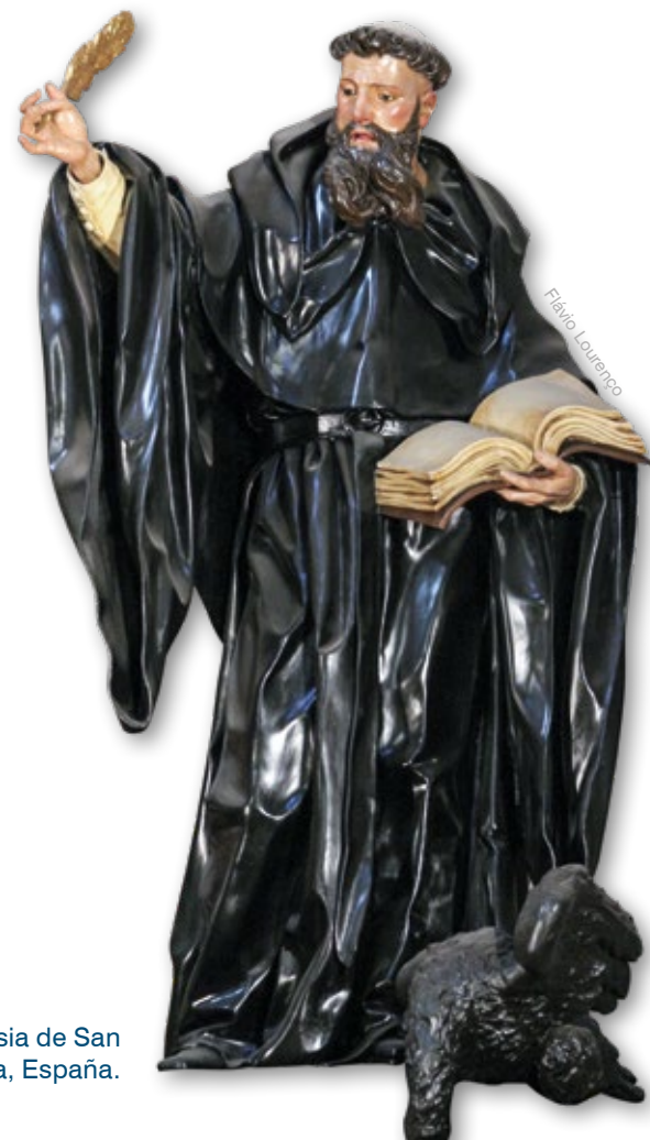
San Agustín - Iglesia de San Jorge, La Coruña, España.

Entonces comprendemos que si miramos a la Santa Iglesia en su esencia, a lo largo de estos tiempos, tenemos la impresión de que ella es una derrotada. Sin embargo, nosotros podríamos hacer una historia de todo cuanto de bello ha aparecido