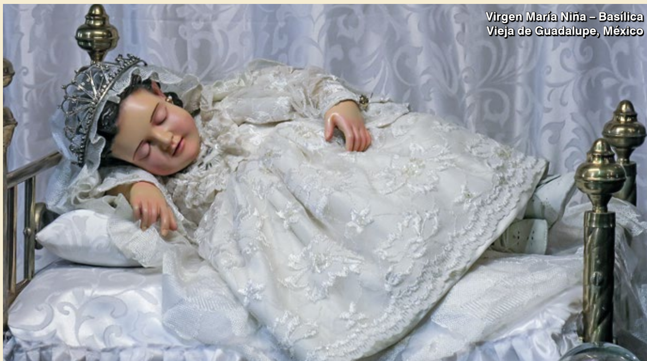
Virgen María Niña – Basílica Vieja de Guadalupe, México

Como se acostumbra comparar el Cielo a la ciudad de Jerusalén, San