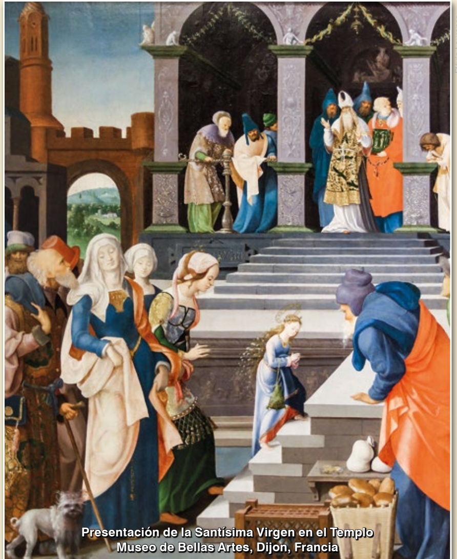
Presentación de la Santísima Virgen en el Templo Museo de Bellas Artes, Dijon, Francia

No obstante, el Templo conoció su plenitud con la célebre venida de Nuestra Señora y de San José, cuando trajeron al Niño Jesús y cuando Ana y Simeón, que representaban la fidelidad, recibieron a la Sagrada Familia. Entonces los fieles reconocie-