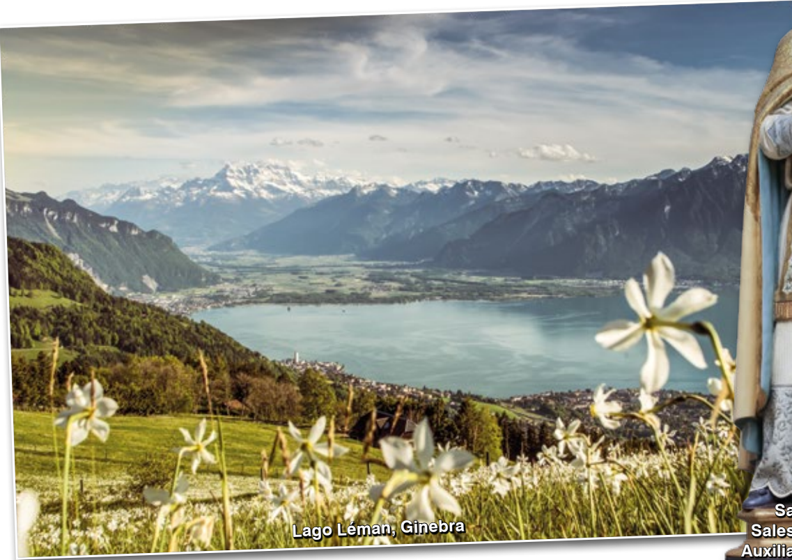
Lago Léman, Ginebra