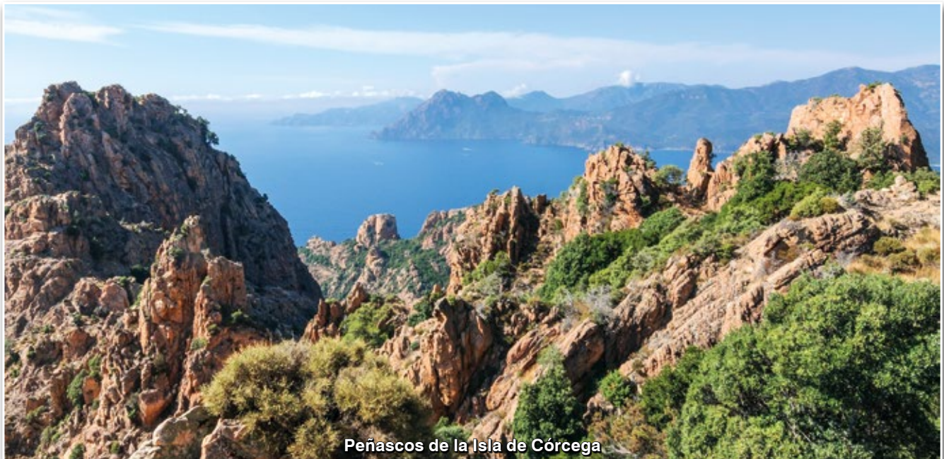
Peñascos de la Isla de Córcega

cia una solución genial individual, sino comprendiendo que debe estar en un ritmo de una solución colectiva; entonces, el pueblo va adaptando, adaptando hasta el punto de originar una obra prima.