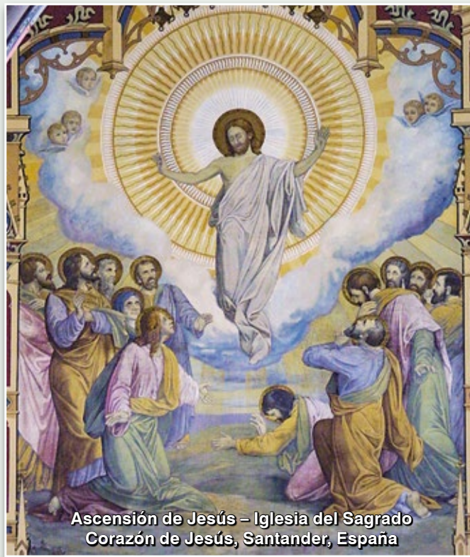
Ascensión de Jesús – Iglesia del Sagrado Corazón de Jesús, Santander, España