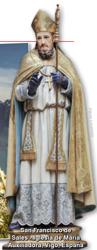
San Francisco de Sales - Iglesia de María Auxiliadora, Vigo, España

en la Esposa de Cristo, desde Lutero hasta nuestros días, y llegar a la conclusión sublime de que Dios fue vencedor, pues la Iglesia fue manifestando cada vez más su pulcritud porque el adversario fue mostrando cada vez más su infamia. Habría de llegar un momento extremo en el que tanto la belleza de la Iglesia Católica como la infamia del adversario se manifestarían en su plenitud, dentro de la desolación extrema.