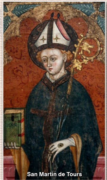
San Martín de Tours

15. San Alberto Magno , obispo y Doctor de la Iglesia († 1280).