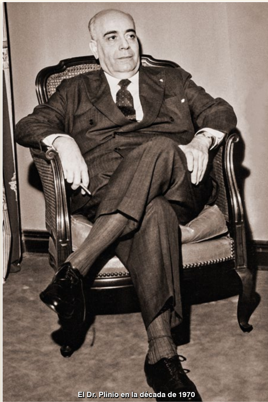
El Dr. Plinio en la década de 1970