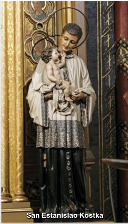
San Estanislao Kostka