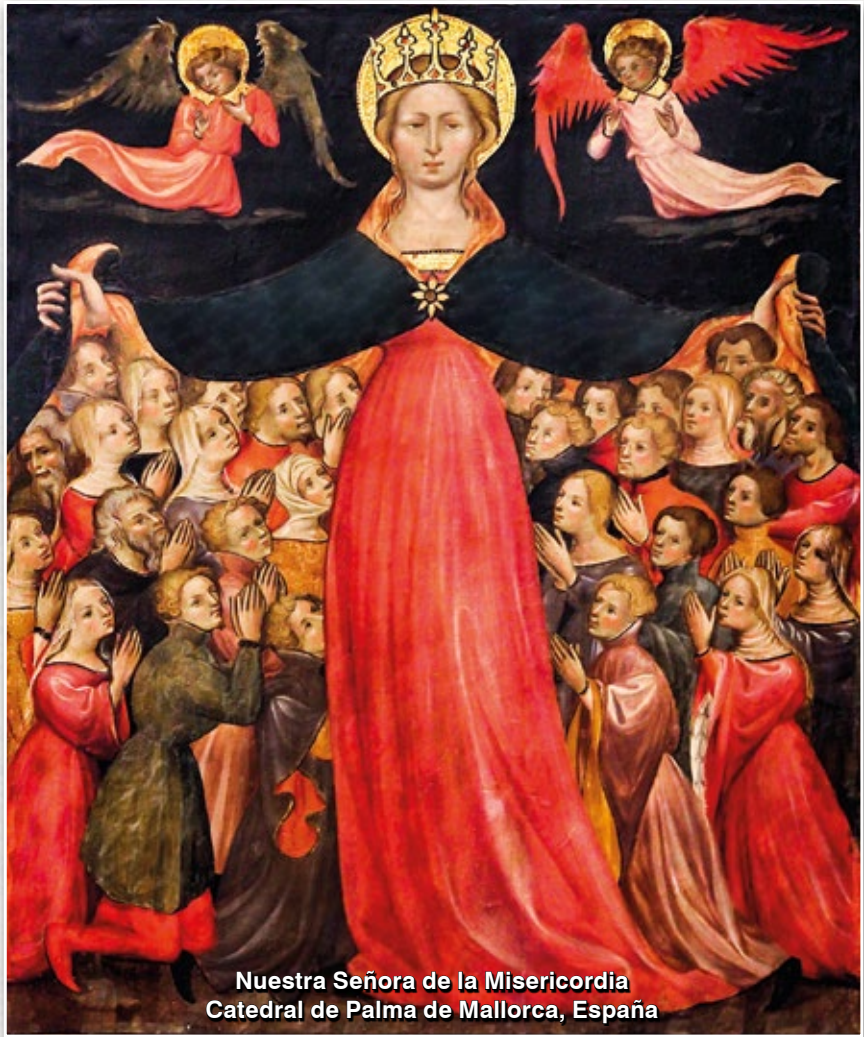
Nuestra Señora de la Misericordia Catedral de Palma de Mallorca, España