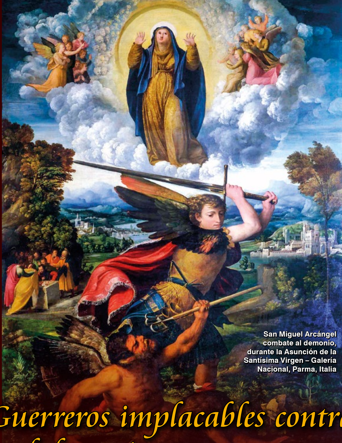
San Miguel Arcángel combate al demonio, durante la Asunción de la Santísima Virgen – Galería Nacional, Parma, Italia