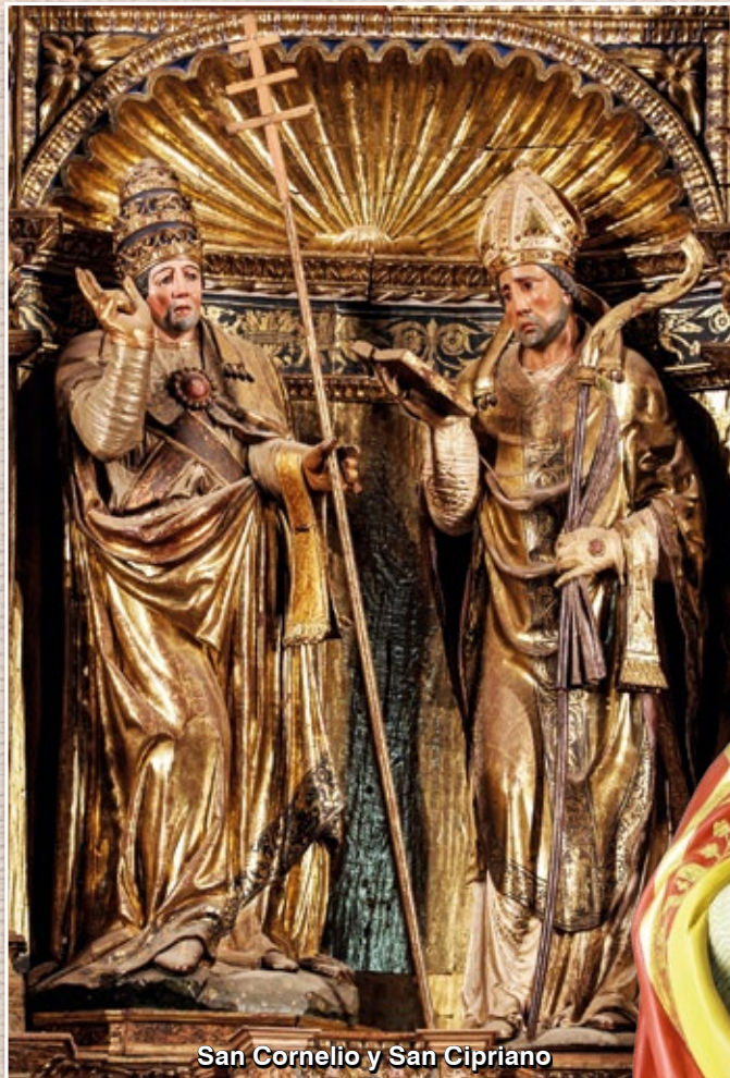
San Cornelio y San Cipriano

Dalmacia y estudió en Roma. Se entregó a la vida ascética en el Oriente, donde fue ordenado sacerdote. De regreso a Roma, fue secretario del Papa San Dámaso quien le encargó de traducir al latín las Sagradas Escrituras, dando origen a la "Vulgata".