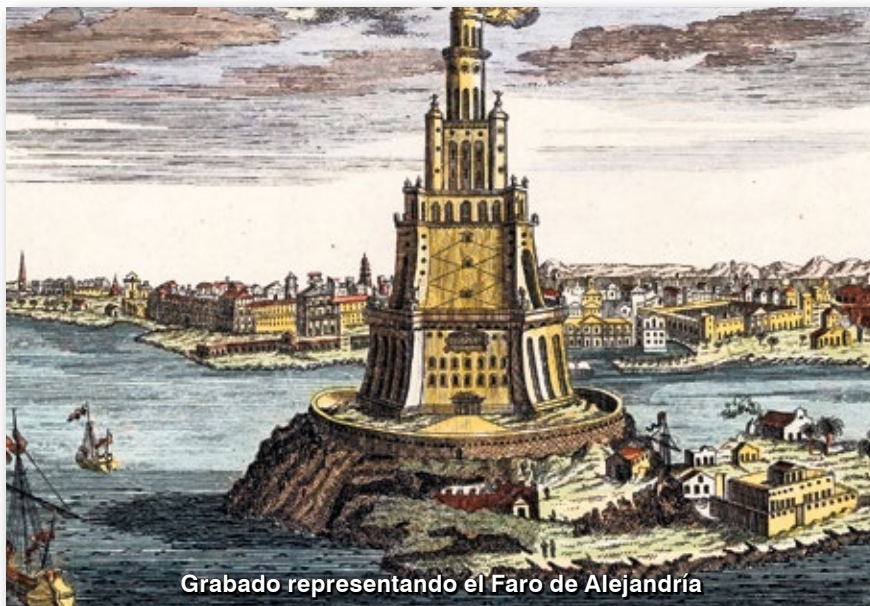
Grabado representando el Faro de Alejandría

Digamos que una persona acaba de hacer un negocio, estuvo en una situación angustiosa de la que un amigo la salvó, en una actitud elegante, con des-