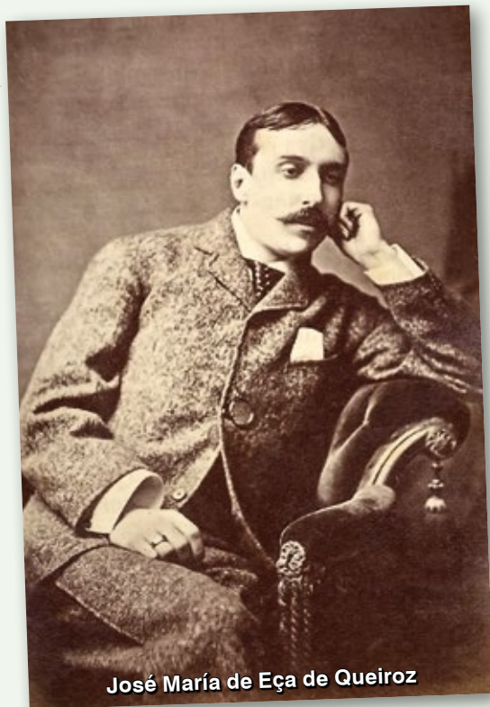
José María de Eça de Queiroz

¿Esto es un defecto o una cualidad? A primera vista, se diría que es un defecto, porque el hombre debería ver lejos y cerca. La vista que es buena, proporcional, ve las estrellas normalmente y lee la letra pequeña del periódico, sin auxilio de lentes. Sabe observar una hormiga y ver una montaña, a lo lejos, así como lo que sucede en la