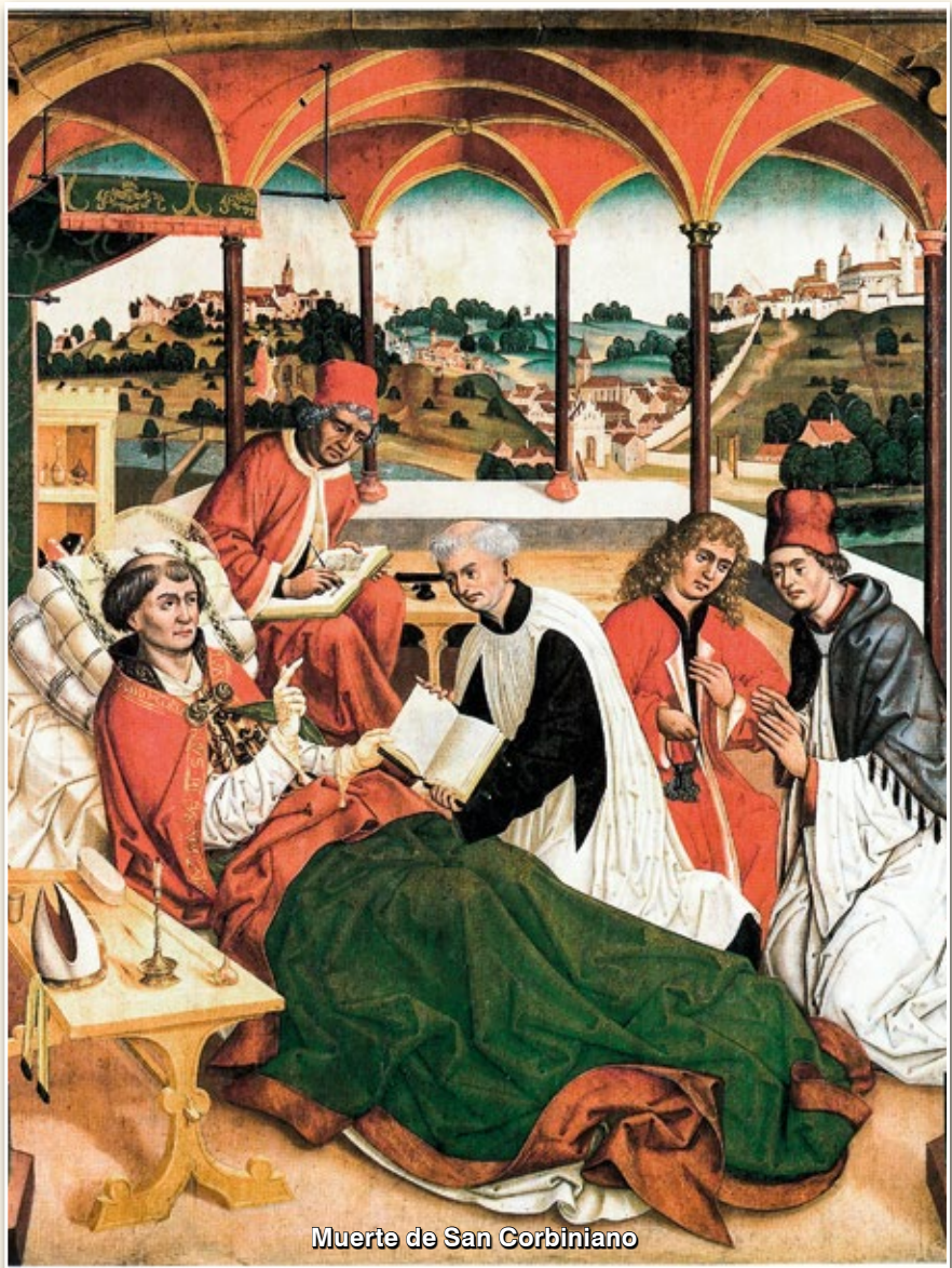
Muerte de San Corbiniano

Hoy tenemos un ejemplo que debe recordarse porque, al menos hasta donde sabemos, no tiene menos belleza que el ejemplo de San Corbiniano. Es el cardenal Mindszenty 2 , quien está preso en Hungría, y sobre quien ha habido tal silencio que casi olvidamos que existe. Pues