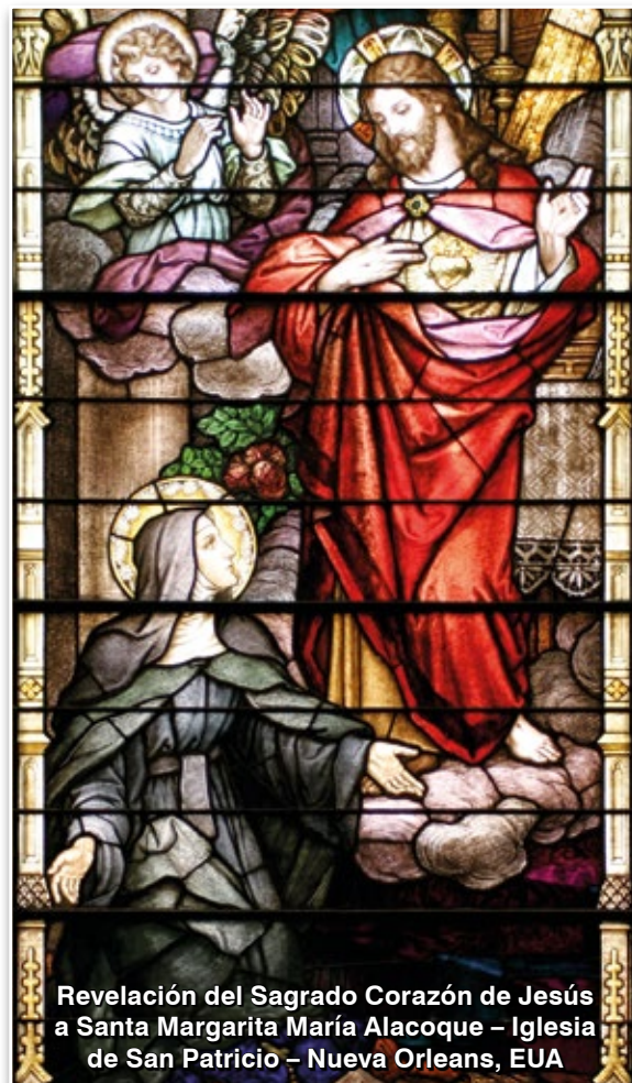
Revelación del Sagrado Corazón de Jesús a Santa Margarita María Alacoque – Iglesia de San Patricio – Nueva Orleans, EUA

Cada persona tiene una singularidad inconfundible. En las relaciones de unos con otros, nacen sorpresas, en este clima de organicidad, que nadie puede prever. Es propiamente la dulzura de Cristo en el Reino de Cristo. Lue-