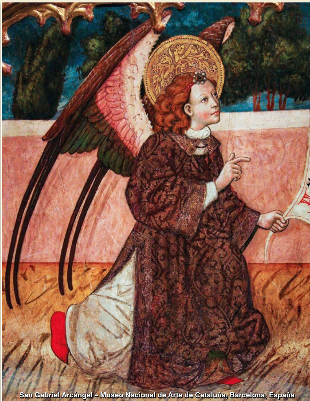
San Gabriel Arcángel – Museo Nacional de Arte de Cataluña, Barcelona, España