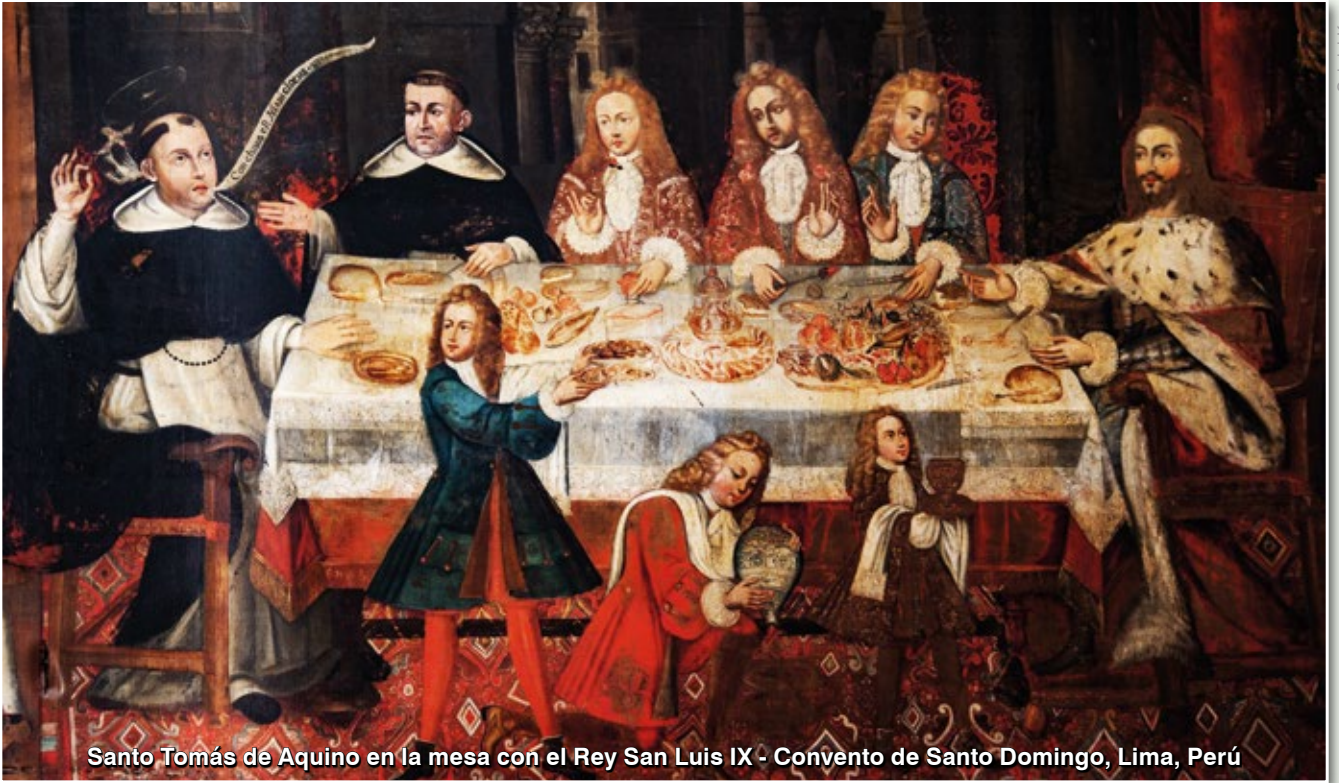
Santo Tomás de Aquino en la mesa con el Rey San Luis IX - Convento de Santo Domingo, Lima, Perú

montaña, sin necesidad de lentes. Esa es la visión perfecta; observa todo lo que interesa a la vista humana.