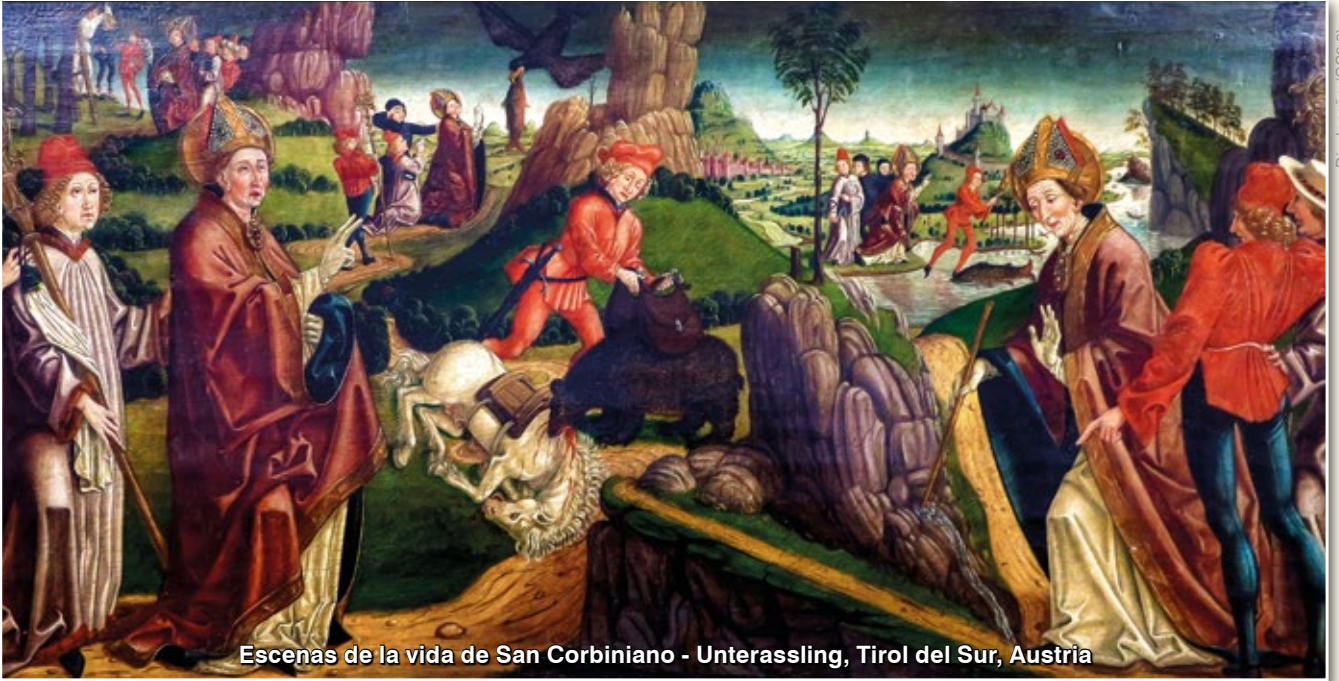
Escenas de la vida de San Corbiniano - Unterassling, Tirol del Sur, Austria

pertenecientes a Grimoaldo, San Corbiniano fue detenido por unos guardias que el duque había situado allí, con la orden de no permitir el paso del obispo, si no aceptaba hacerle una visita.