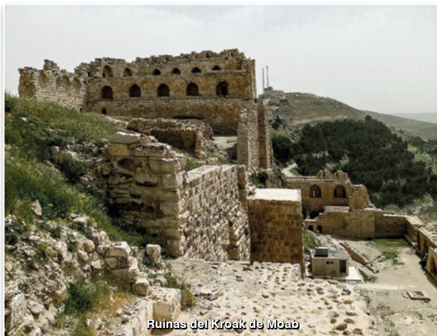
Ruinas del Krok de Moab