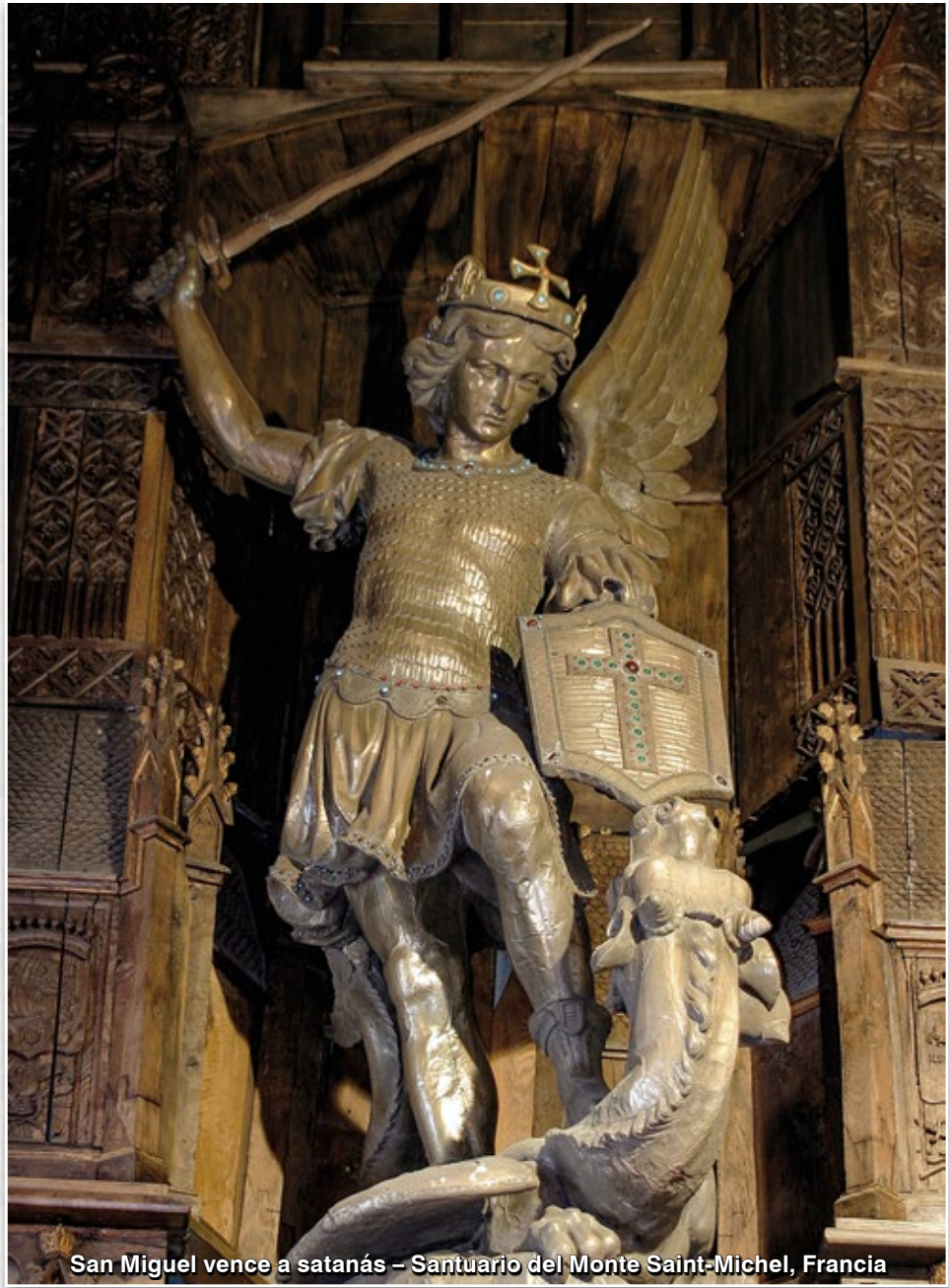
San Miguel vence a satanás – Santuario del Monte Saint-Michel, Francia