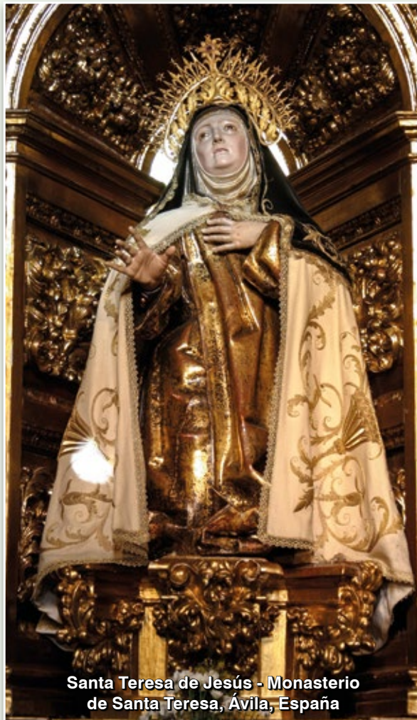
Santa Teresa de Jesús - Monasterio de Santa Teresa, Ávila, España

Esta exposición muestra varias familias de almas. San Ignacio, actuando con la finura de un político, de un ultra político – estoy seguro de que un Talleyrand o un Metternich no sabrían calcular tan bien un saludo como él –, estaba enteramente situado en los sucesos de este mundo. En el extremo opuesto, podemos imaginar a Santo Tomás de Aquino pensando, no en los panqueques, ni en el Rey de Francia, el Santo que tenía al frente, sino exclusivamente en los maniqueos.